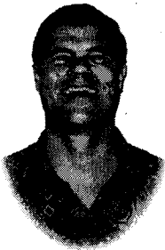
ឆៀល យ៉ាងគីស